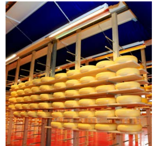
Kaasmakerij Weenink, Lievelede