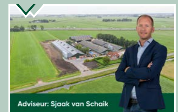
Adviseur: Sjaak van Schaik