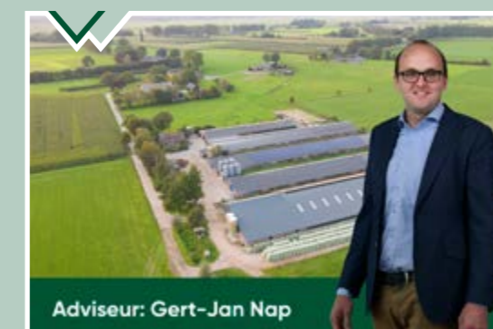
Adviseur: Gert-Jan Nap