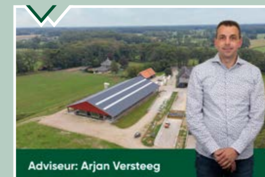
Adviseur: Arjan Versteeg