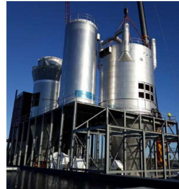
Liprovit melkproducten, Kampen