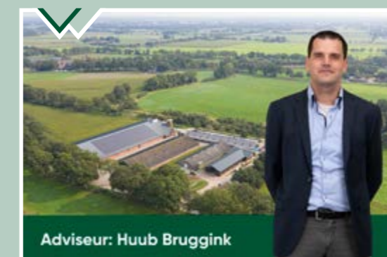
Adviseur: Huub Bruggink