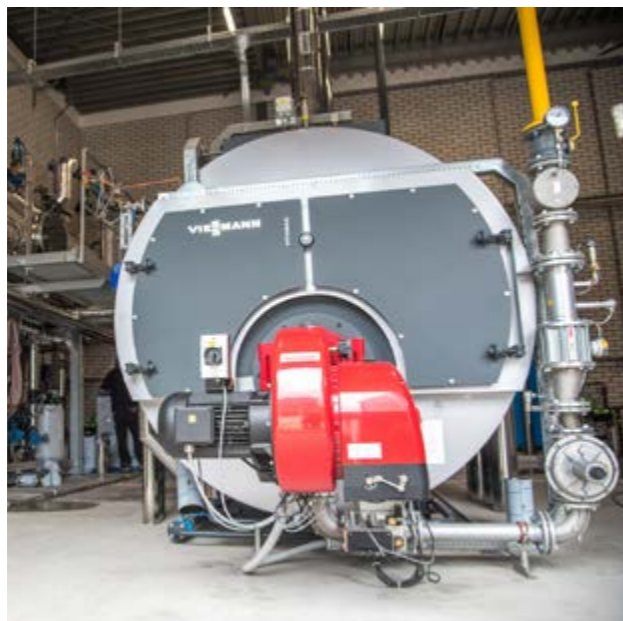
Mengvoederbedrijf Gebrs. Fuite, Genemuiden