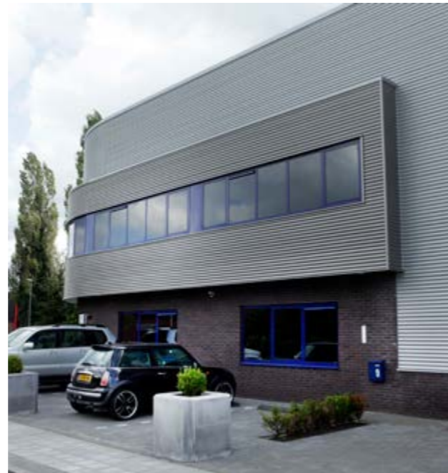
EWAKO Wapeningscentrale, Kootwijkerbroek

Hiernaast en onder vindt u een greep uit de bedrijven die we de afgelopen jaren hebben ondersteund bij hun ruimtelijke ontwikkeling.