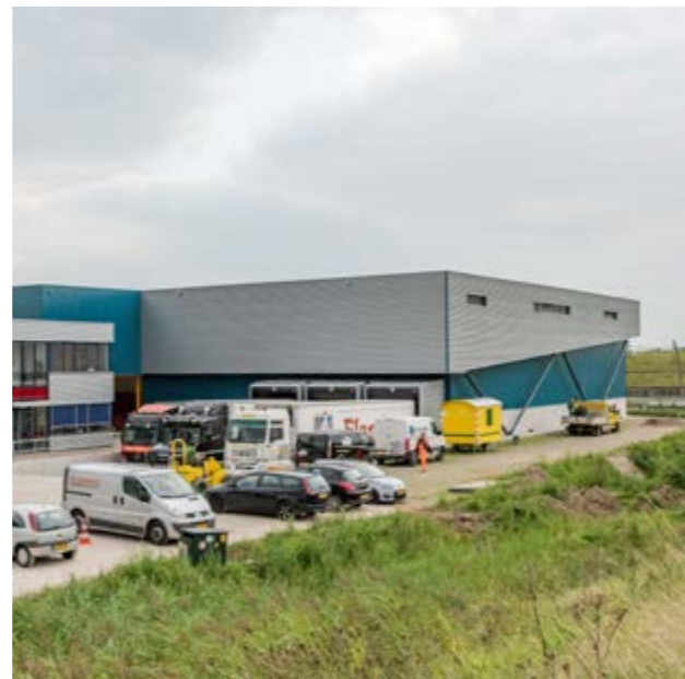
Koel- & Vriesbedrijf Van Soest BV, Kesteren