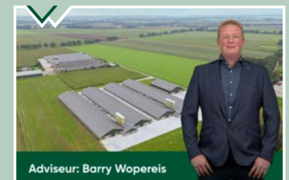
Adviseur: Barry Wopereis