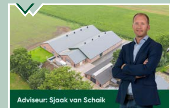
Adviseur: Sjaak van Schaik