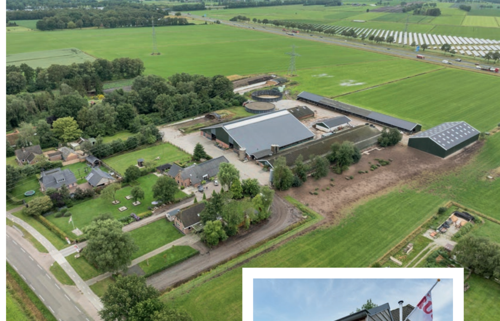
In de nieuwe jongveestal (de lange stal rechtsbovenin) voor 120 stuks jongvee staan drie leeftijdsgroepen in twee rijen boxen.