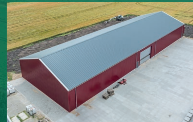
In de nieuwe bewaarschuur kan 900 ton uien of 1.050 ton aardappelen worden opgeslagen.

In de nieuwe bewaarschuur kan circa 900 ton uien of 1.050 ton aardappelen worden opgeslagen.