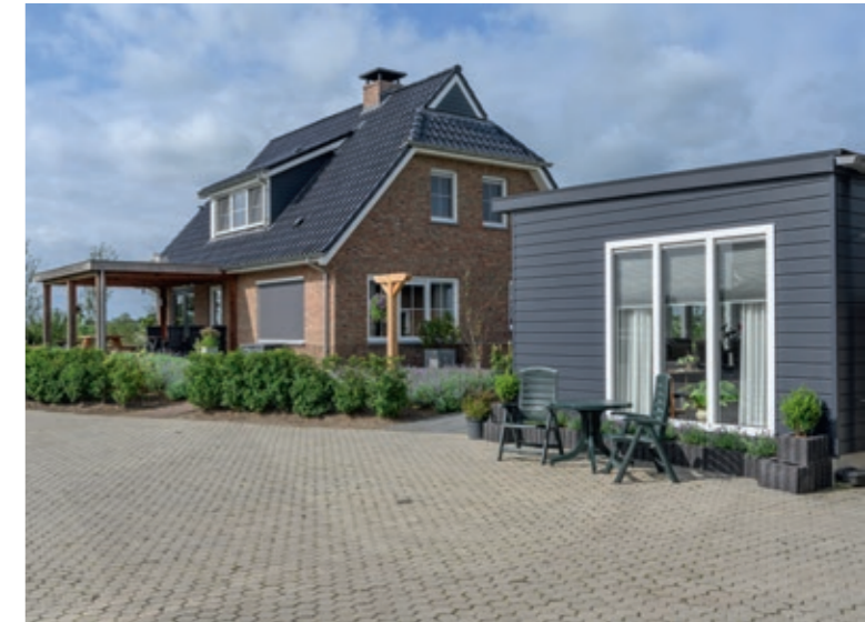
Naast de nieuwe woning werd er ook een mantelzorgwoning aangevraagd voor Henny's moeder.

De tuin staat vol in bloei en aan de vlaggenmast wappert de Nederlandse vlag. Naast en achter de woning staan de kalverstallen, waar het echtpaar 1.700 blankvees-kalveren houdt.