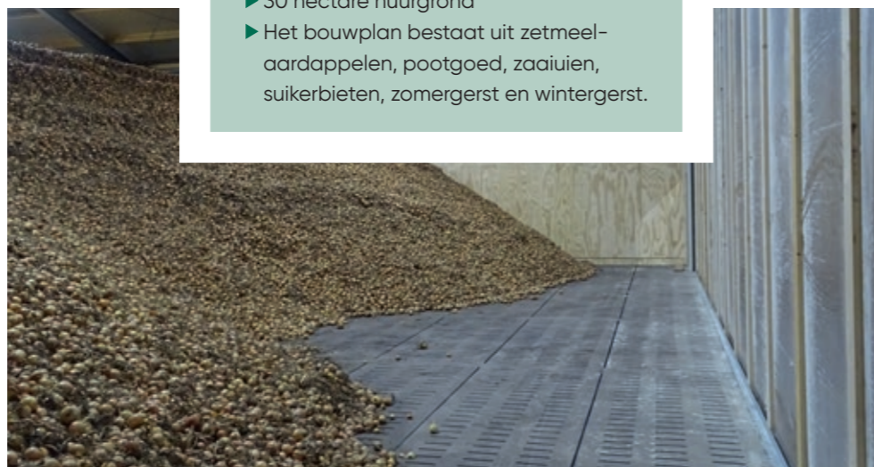
Bruining koos voor een roostervloer met ondergrondse beluchting.

De akkerbouwer kan niet alle uien in de nieuwe opslag kwijt: van de 32 hectare uien die hij teelt, kan hij 18 tot 19 hectare in de schuur kwijt.