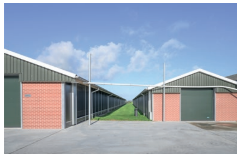
Omdat destijds bij de bouw van de stallen tien meter tussen twee stallen is aangehouden, konden de uitlopen eenvoudig gebouwd worden en wordt er voldaan aan veiligheids- en brandvoorschriften.

„We hadden het geluk dat we destijds bij de bouw tien meter ruimte tussen de twee stallen hebben aangehouden”, vertelt Folkert. „Hierdoor konden we eenvoudig de uitlopen bouwen en voldoen we aan alle veiligheids- en brandvoorschriften.”